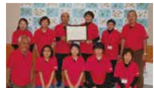
多年にわたる 地域福祉活動