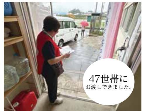
47世帯に お渡しできました。