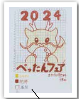
田んぼアート原画