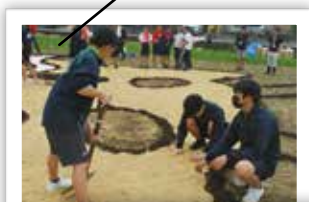
もみ殻を投入し均していく