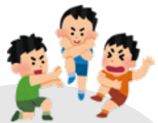
食事のあとはポッチャ大会!! 公民館の中でそれぞれ自由に 過ごし、とても楽しそうでした