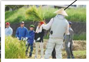
稲刈りの説明を受けます