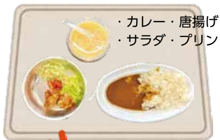
・カレー・唐揚げ ・サラダ・プリン