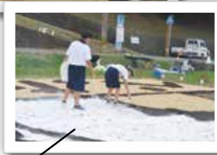
目やひげ等の石灰を入れます