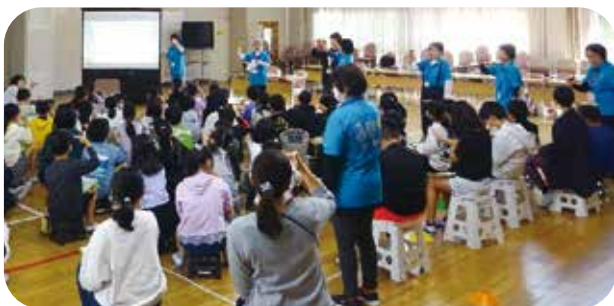
11/14須恵第三小学校 第4学年福祉体験学習