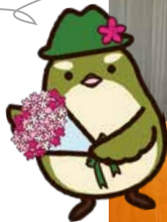
イメージキャラクター すえりん