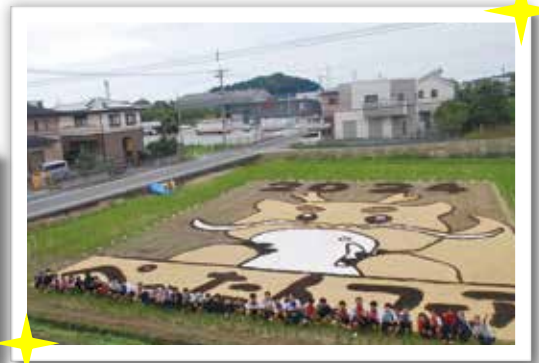
完成です!! 今年の干支「辰」