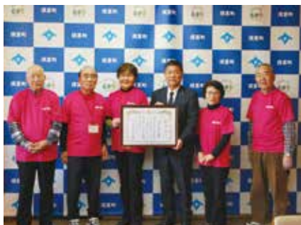
須恵レクの会の皆様