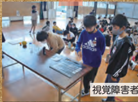
視覚障害者用器具の紹介