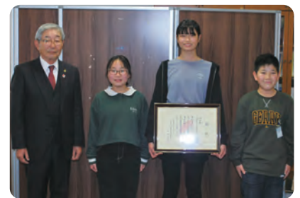
須恵町立須恵第一小学校