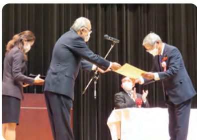
福岡県共同募金会須恵町支会