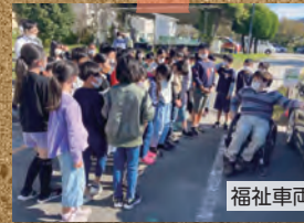
福祉車両の昇降実演