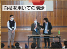
白杖を用いての講話