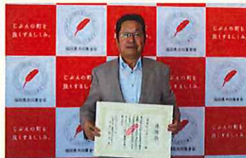
須恵町企業クラブ 様