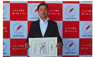
須恵町職員互助会 様