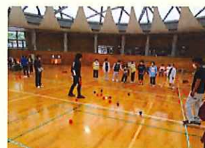
ポッチャ大会の様子

(電話) 933-2160 (メール) sue.shinshoukyou@gmail.com