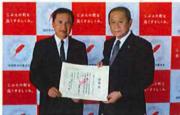
宗教法人 根本山 宝満堂 様

福岡県共同募金会では、高額のお寄せいただいた法人や団体へ感謝状の贈呈を行っています。