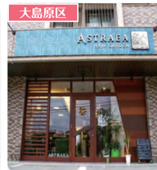
HAIR GARDEN ASTRAEA