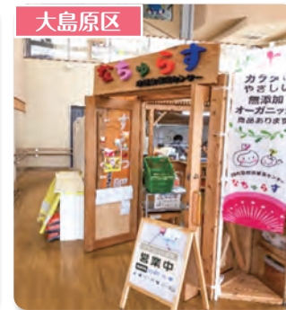
須恵町自然食普及センター