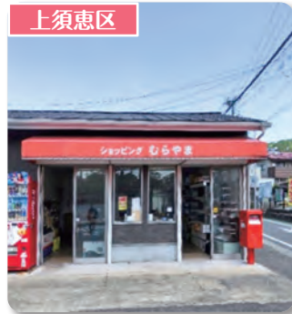
ショッピングむらやま