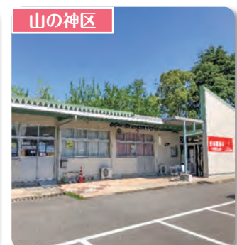
須恵町シルバー人材センター