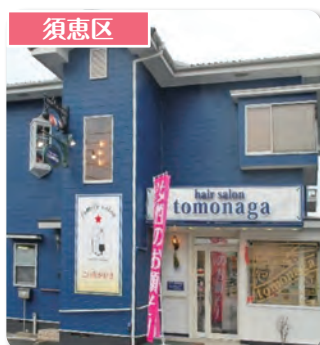
hair salon tomonaga