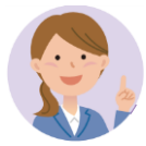
主任ケアマネジャー ケアマネジャー

須恵町地域包括支援センターでは、保健師、社会福祉士、主任ケアマネジャーなどの専門職が連携をとりながら、総合的に高齢者を支援します。